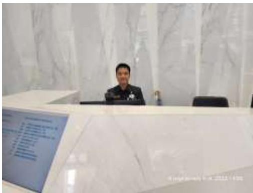
รูปที่ 3 เจ้าหน้าที่รักษาความปลอดภัย