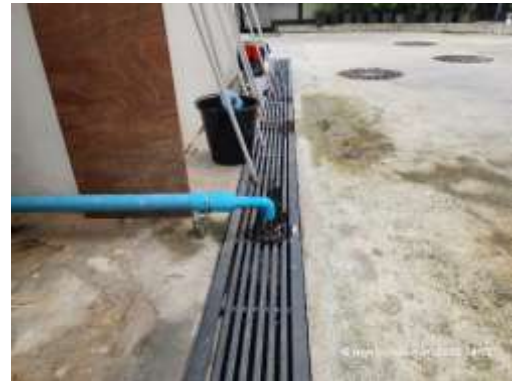
รูปที่ 23 รางระบายน้ำแบบมีฝาปิด