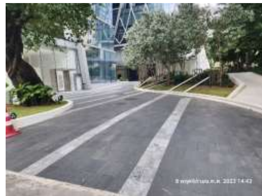
รูปที่ 4 บริเวณทางเข้า-ออก พื้นที่โครงการ