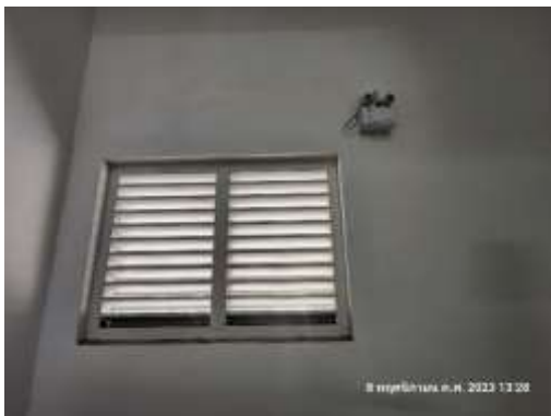
รูปที่ 9 การตรวจสอบช่องเปิดของอาคารไม่มีสิ่งกีดขวาง