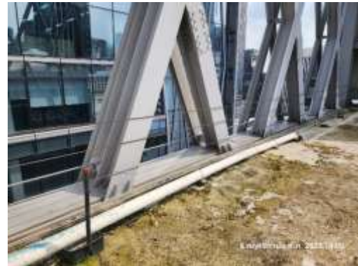
รูปที่ 26 รวากันตกระเบียงดาดฟ้า