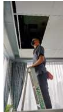
รูปที่ 39 ตรวจสอบรอยรั่ว