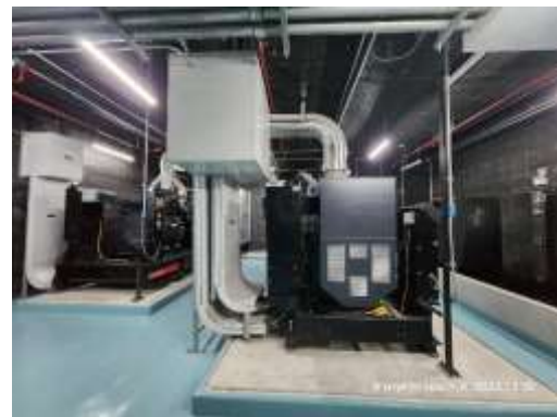
รูปที่ 24 ระบบไฟฟ้าของโครงการ