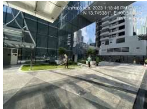
รูปที่ 2 เจ้าหน้าที่ดูแลรักษาพื้นที่และความเป็นระเบียบภายในโครงการ