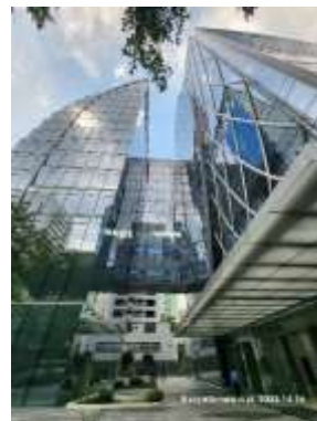
รูปที่ 10 การเลือกใช้กระจกประกอบอาคารดูดซับความร้อนต่ำ