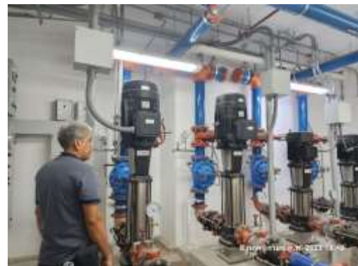
รูปที่ 20 ระบบสูบน้ำภายในโครงการและเจ้าหน้าที่ตรวจสอบ