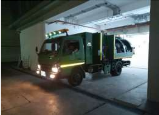
รูปที่ 14 เจ้าหน้าที่รวบรวมมูลฝอยส่วนกลาง และห้องพัสดุฝอย