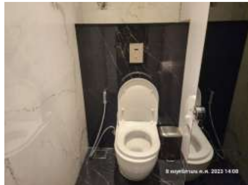
รูปที่ 37 สุขภัณฑ์ประปัยน้ำ