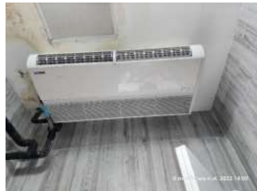
รูปที่ 16 ห้องพัสดุฝอยและป้ายรณรงค์