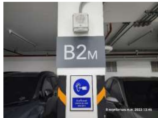
รูปที่ 42 ป้ายเตือน “ห้ามติดเครื่องขณะจอดรถ”