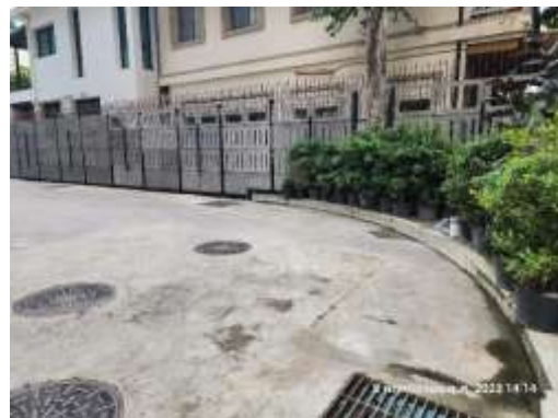
รูปที่ 38 รั้วรอบพื้นที่โครงการ