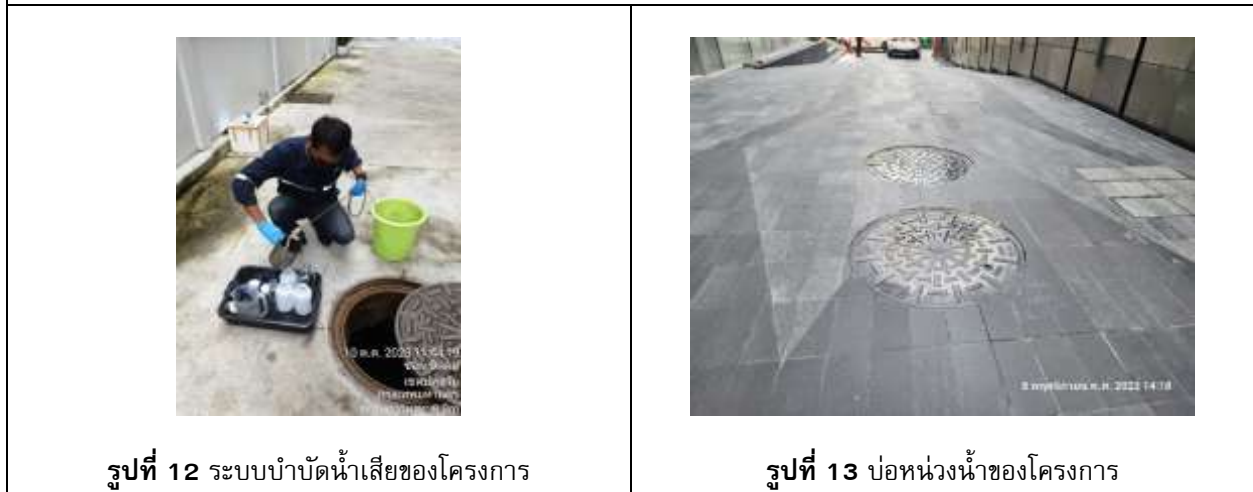
รูปที่ 12 ระบบบำบัดน้ำเสียของโครงการ