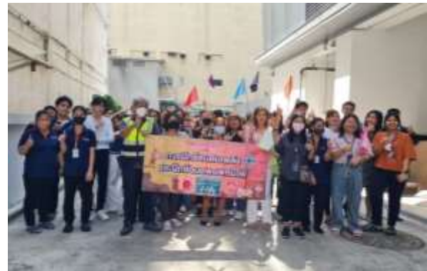
รูปที่ 47 การฝึกซ้อมดับเพลิงและอพยพหนีไฟ