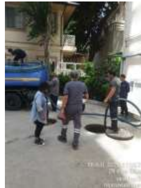
รูปที่ 27 สืบสิ่งปฏิกูลระบบบำบัดน้ำเสีย