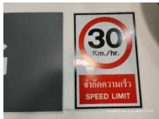
รูปที่ 34 ป้ายจำกัดความเร็ว