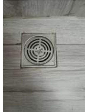
รูปที่ 15 รางระบายน้ำภายในห้องพัสดุฝอย