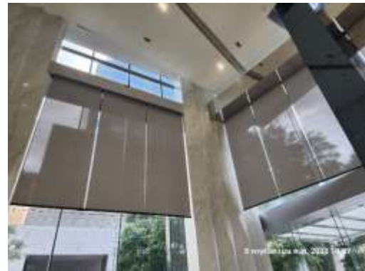
รูปที่ 40 ติดตั้งผ้าม่าน/มู่ลี่