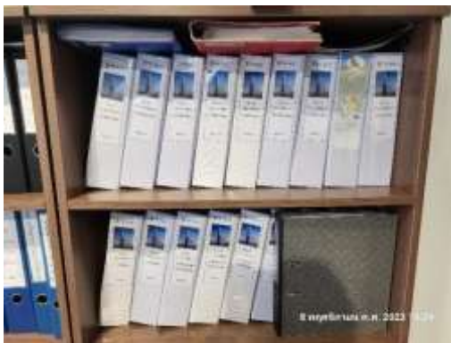
รูปที่ 32 คู่มือการบำรุงรักษาระบบไฟฟ้า