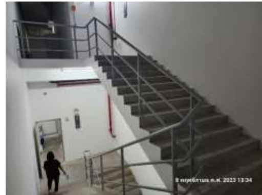
รูปที่ 43 บันไดหนีไฟ