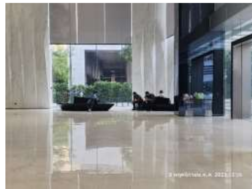
รูปที่ 19 พื้นที่ส่วนกลาง สำหรับพักผ่อนและกิจกรรมนันทนาการ