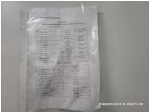
รูปที่ 30 เบอร์ดู๊กฉนวนบริเวณห้องเครื่องไฟฟ้า