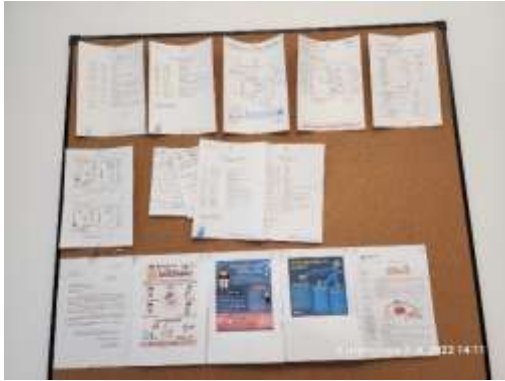
รูปที่ 35 ป้ายประชาสัมพันธ์ต่าง ๆ