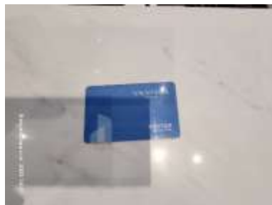
รูปที่ 5 บัตรผ่านชั่วคราวสำหรับบุคคลภายนอก