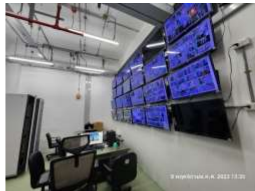
รูปที่ 8 กล้องวงจรปิด (CCTV) และระบบควบคุม