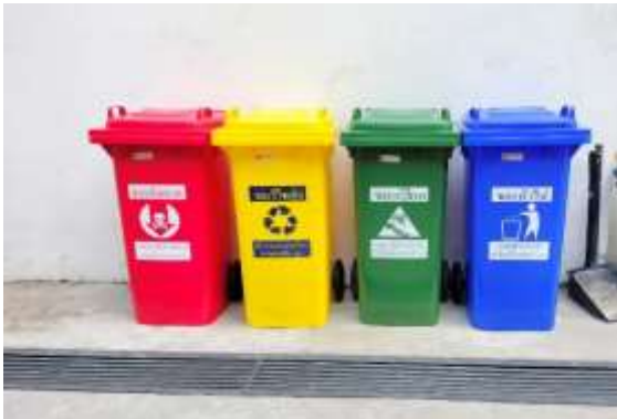
รูปที่ 17 ภาชนะรองรับมูลฝอย