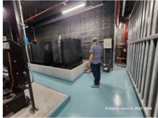
รูปที่ 36 เจ้าหน้าที่ตรวจสอบระบบไฟฟ้า