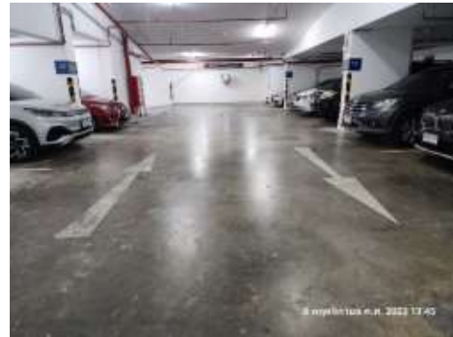
รูปที่ 7 ไฟส่องสว่างบริเวณพื้นที่จอดรถ