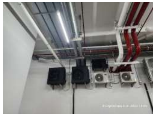
รูปที่ 45 พัฒนาระบายอากาศบริเวณพื้นที่จอดรถภายในโครงการ