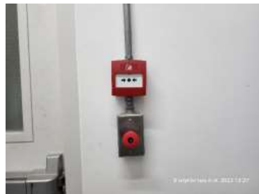
รูปที่ 22 อุปกรณ์และระบบป้องกันอัคคีภัย