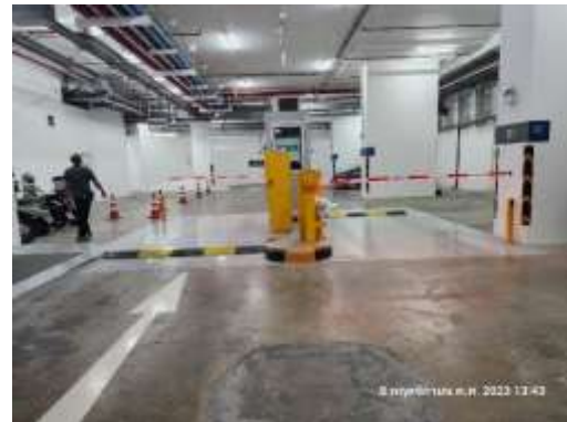
รูปที่ 44 สันหนชะลอความเร็ว