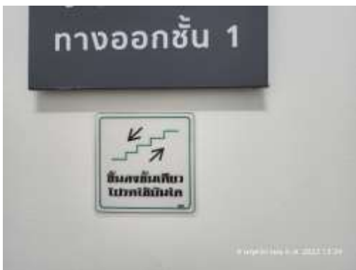
รูปที่ 33 ขึ้น-ลง ชั้นเดียวให้ใช้บันไดแทนลิฟต์