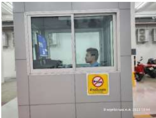
รูปที่ 41 ป้ายประชาสัมพันธ์ “ห้ามสูบหรี่”