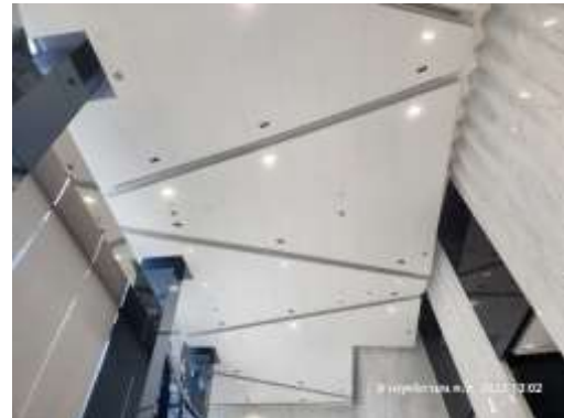
รูปที่ 18 อุปกรณ์ชนิดประหยัดไฟ